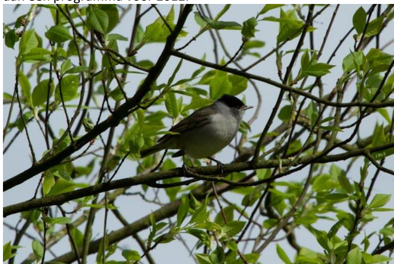
Foto van de eerste zwartkop in de Schoolsteegbosjes in 2011 bij de minicursus vogels herkennen en zang

Met betrokken partijen zijn de afspraken wat nader vastgelegd en is gebrainstormd over en gewerkt aan een programma voor 2012.