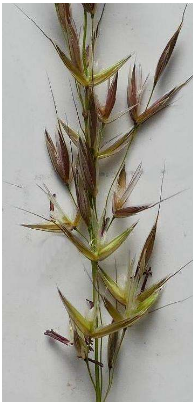
De bloeiwijze van glanshaver is een lange pluim

De aartjes van glanshaver hebben twee bloemen. Het belangrijkste kenmerk is de naald van de onderste bloem, die aan de rugzijde een lange, geknikte naald heeft, wel 10 tot 15 millimeter lang. Ook in verdroogde vorm is deze naald nog goed te zien. Een bloem van een gras is prachtig opgebouwd, maar je moet er wel een loep bij gebruiken. Een gras heeft twee