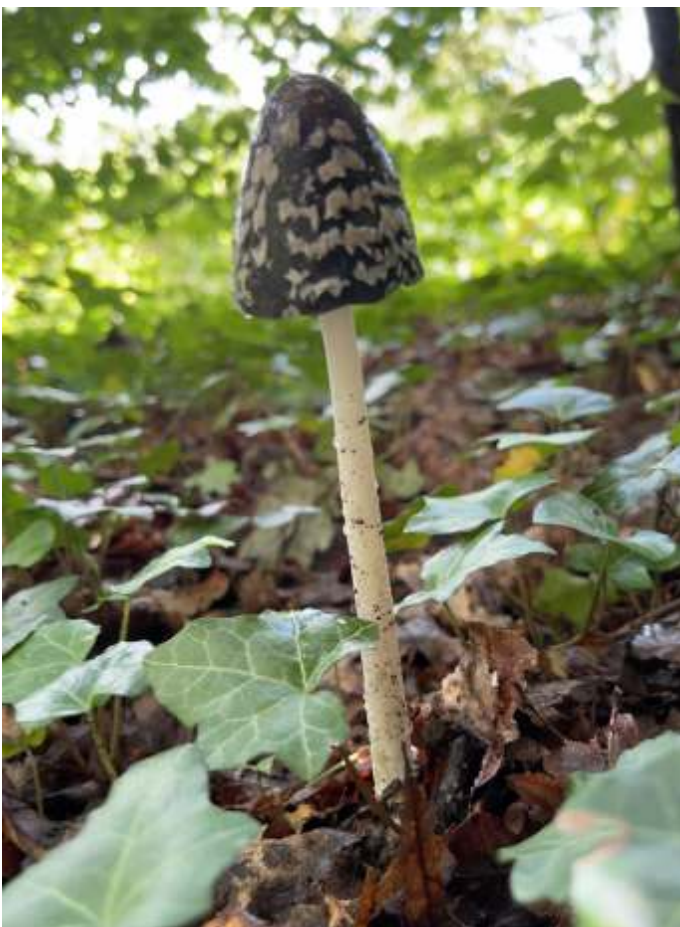
De zeldzame spechtinktzwam

Als schoolkinderen roken we de andere geur van een lindebos vergeleken met een beukenlaan. En voor we het wisten stonden we met een uilenveer over onze wangen te vegen, zo zacht! Een rondleiding voor alle zintuigen dus!