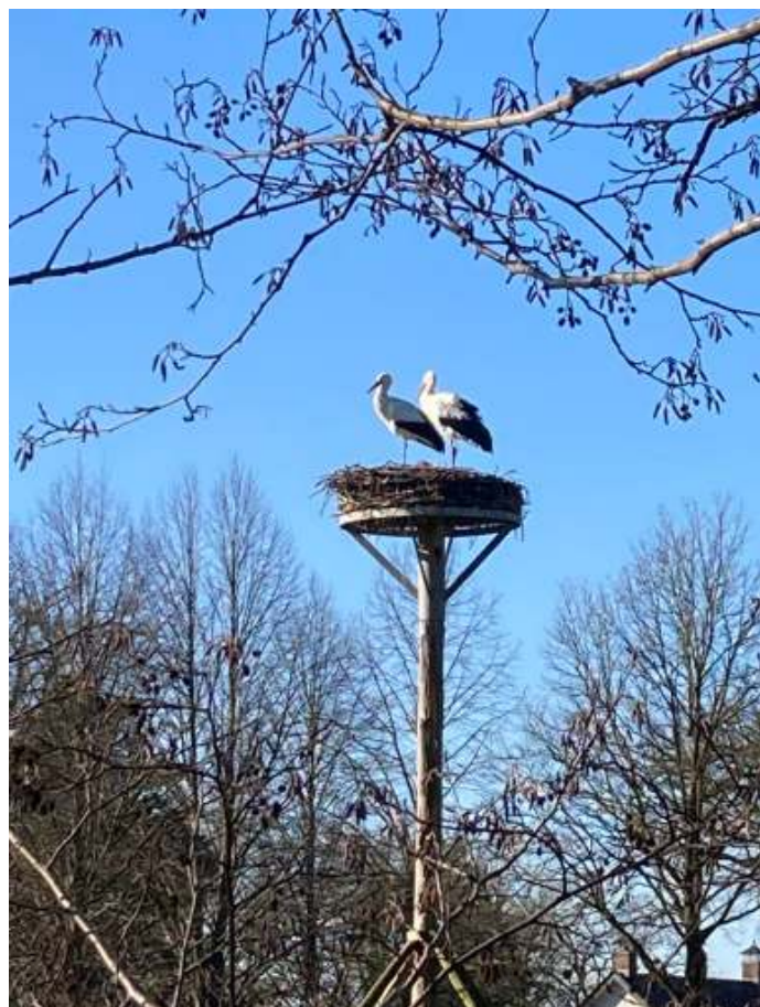
Het ooievaarsnest van landgoed De Boom

Na anderhalf uur zijn we weer terug bij het startpunt.