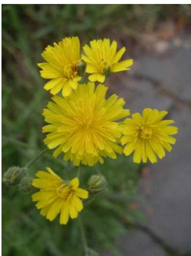
Een bloemhoofdje telt gemiddeld vijftig lintbloemen