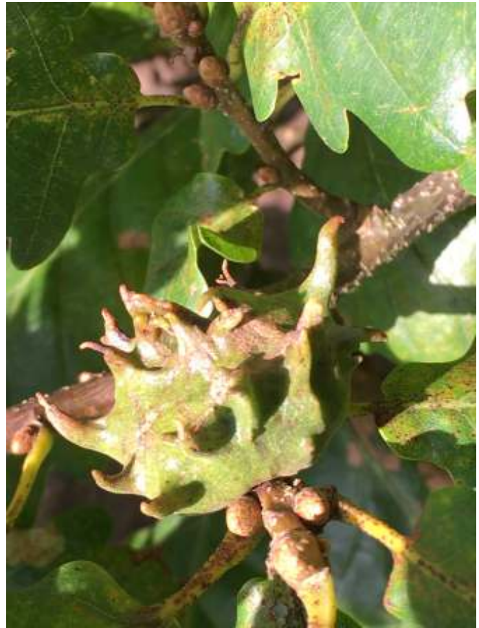
Gordelgal op wintereik