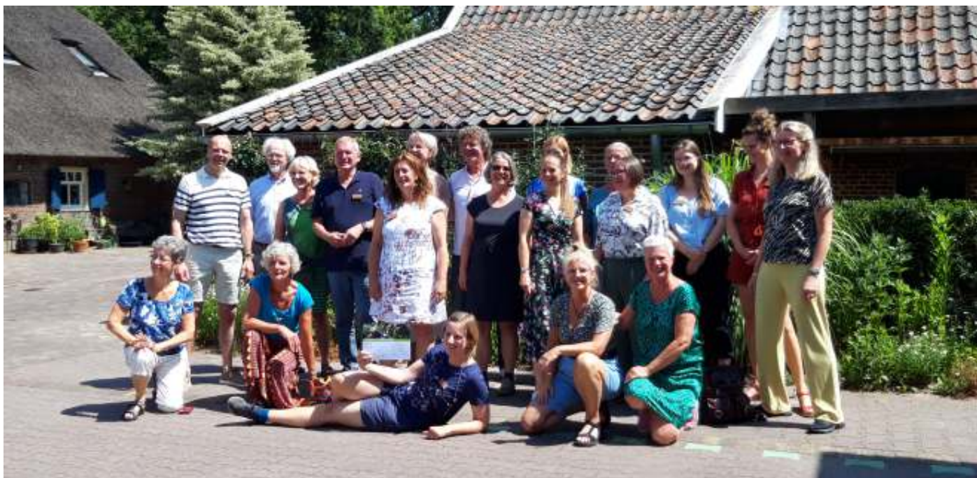
Achttien nieuwe natuurambassadeurs op Groot Zandbrink

Wat is het fijn om daarop te kunnen terugkijken. En wat een mooie toekomst.