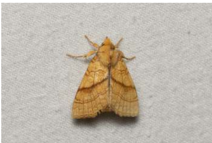
De lindegouduil is een typische najaarssoort Deze foto hoort bij het artikel over de Nationale Nachtvulindernacht 2023 op pagina 14/15.