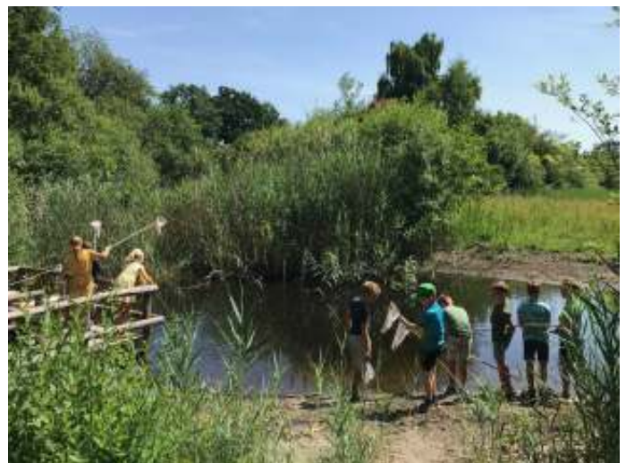
De Eemstruiners op Heerlijkheid Stoutenburg

We kijken terug op een leuke dag en op een fantastisch seizoen met een gemiddelde opkomst van achttien kinderen. Natuurlijk gaan we volgend seizoen weer van start met een nieuw programma en we hopen daar jullie allen weer te zien. Wij wensen jullie een fijne vakantie allemaal! Diegene die er volgend seizoen niet meer bij zijn, wensen wij ook nog heel veel struinplezier in de open lucht.