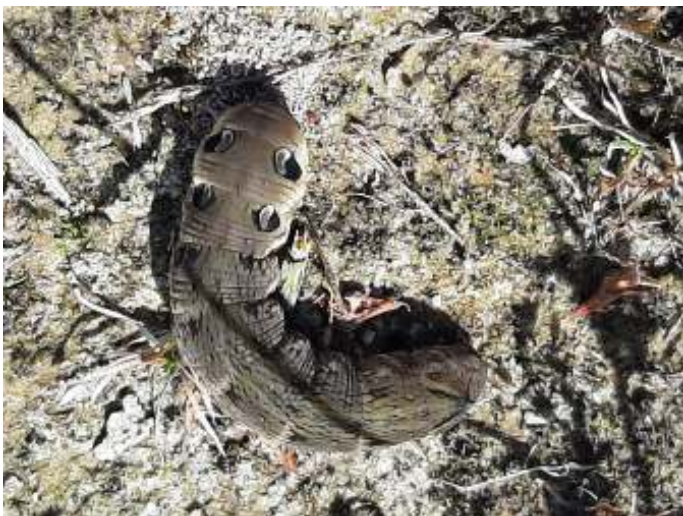
De rups van groot avondrood is vijf centimeter lang