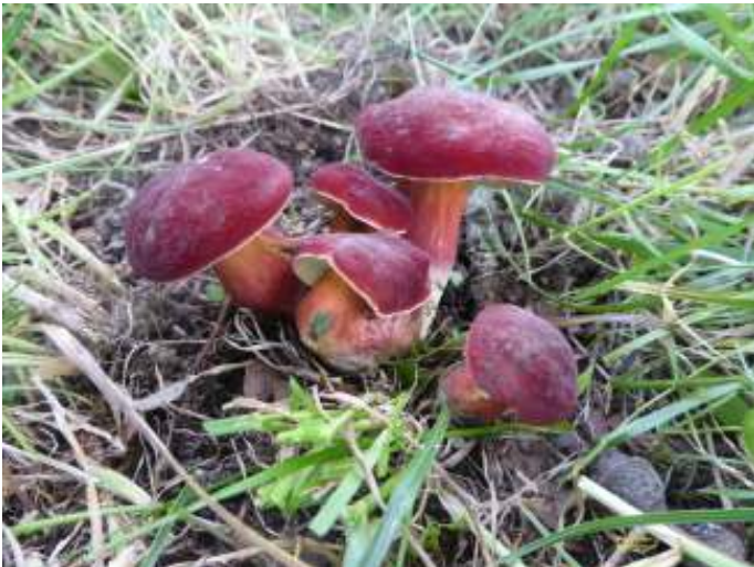
Rode boleten

Een paddenstoel is vergelijkbaar met de vrucht van een appelboom: de appel. De vruchten van schimmels schieten bij vochtig weer in nazomer en herfst als paddenstoelen uit de grond. In het bos van Nimmerdor kunnen we allerlei paddenstoelen vinden, vooral omdat er veel oud hout ligt. Gaat u mee? Neem dan een spiegeltje mee om de onderkant van de paddenstoel te kunnen bekijken.