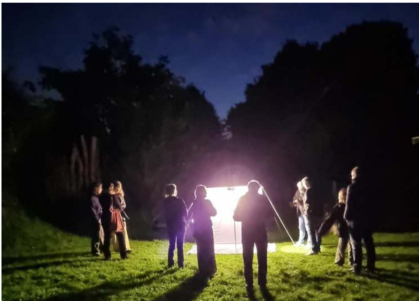
De Werkgroep insecten van KNNV Amersfoort zorgde voor lakens met nachtvliederslampen in de struintuin van de Groene Belevens in Leusden

We zagen een zwart weeskind, een van de grootste uilen die in Nederland voorkomt. Normaal gesproken komt deze vlinder eerder op smeer af dan op licht. Ook kwam de gepluimde snuituil op het laken. Ook