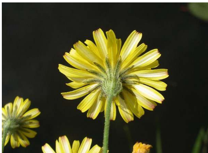
De omwindselblaadjes aan de onderkant van het bloemhoofdje zijn sterk bekleerd