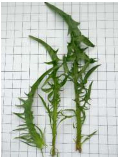
De stengelbladeren zijn bochtig en spits geveerd (links op de foto). De rozetbladeren zijn aan de voet dubbel veerspletig (rechts op de foto).