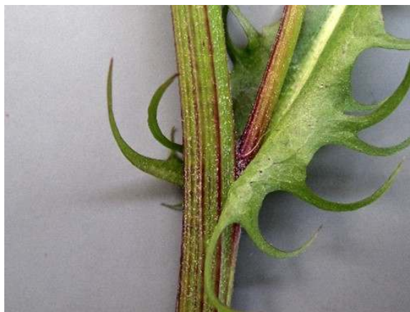
De stengelbladeren krullen om de stengel heen, met twee naar beneden gerichte oortjes