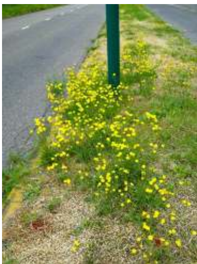
In een droge zomer zie je in gemaaide bermen slechts één gele composiet