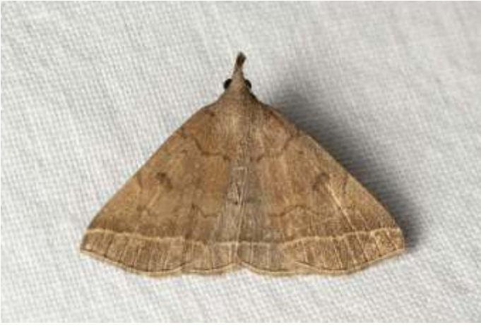
De gepluimde snuituil is in opmars

deze vlinder is zeldzaam, maar sterk in opmars. We troffen nog meer uilen zoals onder andere het eikenuiltje, de bruine sikkeluil en de zwarte c-uil. Alle vlinders, ook de microvlinders, zijn zoveel mogelijk op naam gebracht. De volledige lijst van soorten staat op waarneming.nl