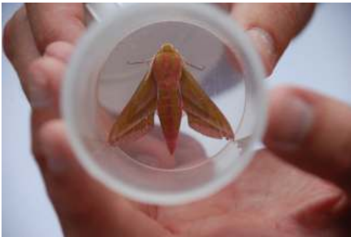
Groot avondrood

De rups heeft een pijlstaartje. Zijn lijf is versierd met niervormige, witomrande oogvlekken en talloze zwarte streepjes. Als de rups zich verpopt, komt er een supermooie vlinder tevoorschijn. Groot avondrood is een nachtvlinder die zijn naam dankt aan de rozerode tint.