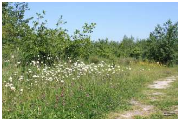
Bloeidaal bloeit

Wat is de reden geweest voor het aanleggen van het nieuwe natuurgebied Bloeidaal ten oosten van Amersfoort? Hoe zag het er in het verleden uit en hoe is het veranderd? Langs welke 'weg' werd het van een eentonig grasland tot een gevarieerd schraalgrasland? Langs de oostkant van Bloeidaal loopt de Barneveldse beek richting het Gelders Valleikanaal. Wat is de invloed van deze beek op het natuurgebied? Is deze invloed ook zichtbaar in het terrein? Deze vragen stonden centraal bij een wandeling door Bloeidaal, onder leiding van gidsen van Utrechts Landschap en IVN. Ook was er veel aandacht zijn voor de flora en fauna in Bloeidaal.