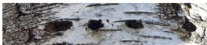
Gaatjes van de boomklever

Voordat we het terrein af zijn, zien we al: afgeknaagde dennenappels door de eekhoorn en specht; kleine