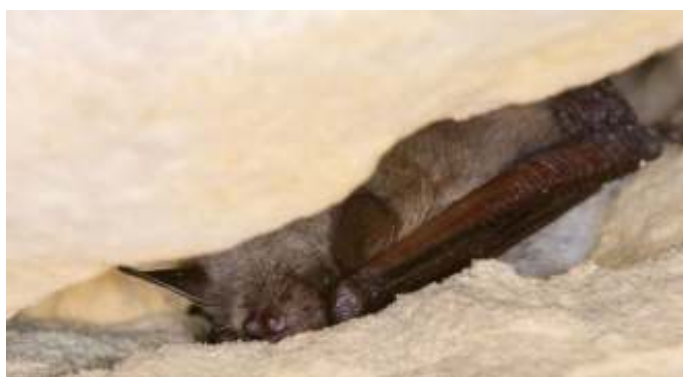
Kolonies van meervleermuizen bevinden zich vrijwel altijd in gebouwen.

In de winter verdwijnen de meeste meervleermuizen op mysterieuze wijze. In Nederland worden in de winter totaal ongeveer 750 meervleermuizen waargenomen, in buurlanden nog eens maximaal 350 dieren. Voor zover we weten overwinteren meer-