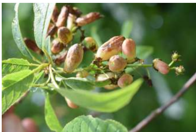
Vogelkersschimmel. Kees de Heer fotografeerde op landgoed Schothorst gallen op de vogelkers. De vogelkersschimmel Taphrina padi zorgt voor een vreemde vergroeiing van de bloemen. Deze aangetaste bloemen leveren geen gewone bessen op, maar langwerpige vruchtjes die hol zijn.