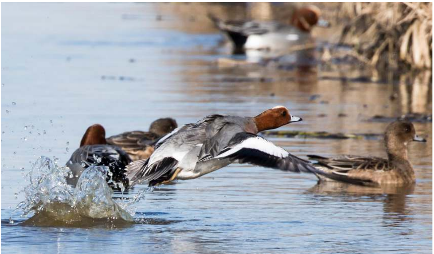
Vliegende smient.

genomen. We begonnen met een verhaal over de indeling van het dierenrijk in stammen, klassen, orden, families, geslachten en soorten. De insecten vormen hierin een klasse. Binnen deze klasse wordt ingezoomd op de verschillende orden, zoals vlinders, libellen, kevers, enzovoorts. Aan de hand van een voorbeeld werd dit toegelicht. Vervolgens werden van de meest bekende orden voorbeelden en eigenschappen gegeven. Wat onderscheidt een kever van een wants. Wat is het verschil tussen een dagvlinder en een nachtvlinder? Bijzonder is de techniek van het fotograferen van insecten. De docent Jan van Hasselt had daar veel ervaring mee en liet schitterende, zelfgemaakte foto's zien.