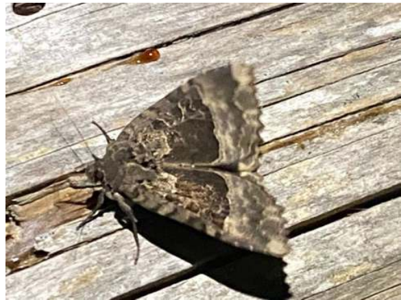
Zwart weeskind

De Kleine zomer vlinder ( Hemithea aestivaria ) was de eerste die zich meldde. Maar pas 23.40 uur kwamen meer spanners op de lakens. En zoals gebruikelijk kwamen na 00.00 uur de pijlstaarten: 4x Groot avondrood ( Deilephila elpenor ), waarvan 1 in de lichtval en 3x Ligusterpijlstaart ( Sphinx ligustri ).