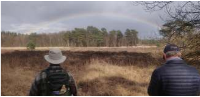
Regenboog boven het Hazenwater

nijnenholen zijn, én er ligt een hoopje reeënkeutels. Ook zijn er resten van een schedeltje van een jong konijn. De tijd dringt en we lopen terug en we zijn verrast door de vele diersporen die we met zeven paar ogen hebben gezien.