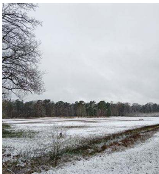
Klein Schuttershoef: sporen, laan en veld