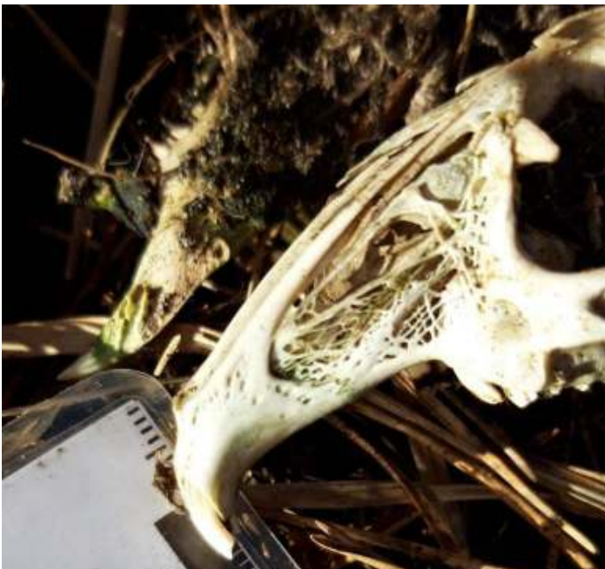
Schedel van een konijn