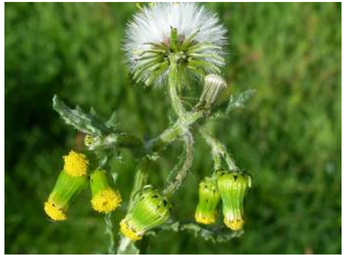
Klein kruikruid, is tijdens de Eindejaarsplantentelling 2022-2023 i het vaakst geturfd.

De Plantenjacht is altijd een leuke bezigheid in deze winterdagen. Rond Kerst en de jaarwisseling is de werkgroep vijf keer op pad geweest. Totaal hebben