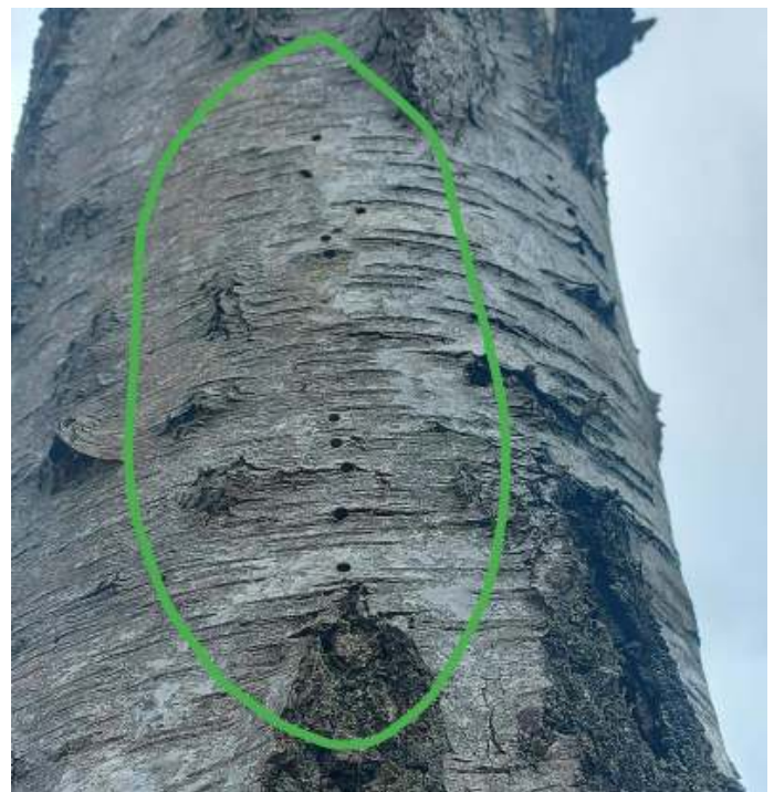
Gaatjes van de berkenspintkever

De zon schijnt en het regent, waardoor we een prachtige regenboog zien richting het Hazewater. Even een moment van stilte om dit te bewonderen. We lopen verder naar het heideveldje waar veel ko-