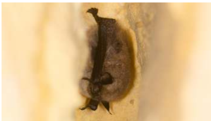
Meervleermuis. De Zoogdiervereniging heeft 2023 uitgeroepen tot het 'Jaar van de Meervleermuis'.

De meervleermuis jaagt in een snelle rechtlijnige vlucht in lange trajecten vlak boven groot open water en langs oevers van plassen, meren, kanalen, rivieren en vaarten. Nederland is een land van water, dus de meervleermuis voelt zich hier helemaal thuis. Meervleermuizen worden ook wel regelmatig waargenomen boven vochtige weilanden en bosranden, binnen een straal van vijfhonderd meter van water. Ze jagen vooral op die insecten die op het wateroppervlak zitten of daar vlak boven vliegen. De prooien worden