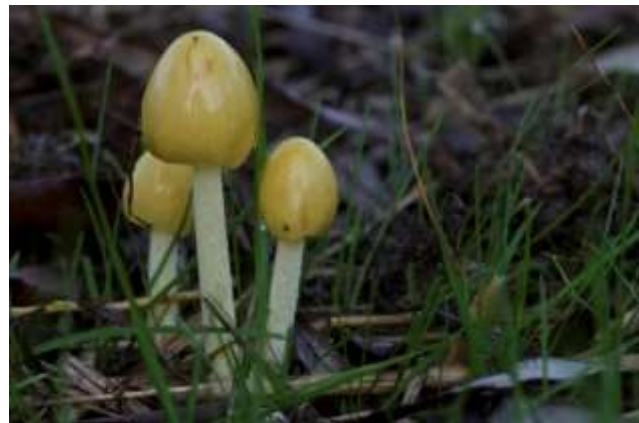
Dooiergele mestzwam.

Op verzoek van IVN Nijkerk hebben Ruud van Veenschoten en ondergetekende in november een Paddenstoelen excursie verzorgd in Nimmerdor in het kader van hun Natuurgidsenopleiding.