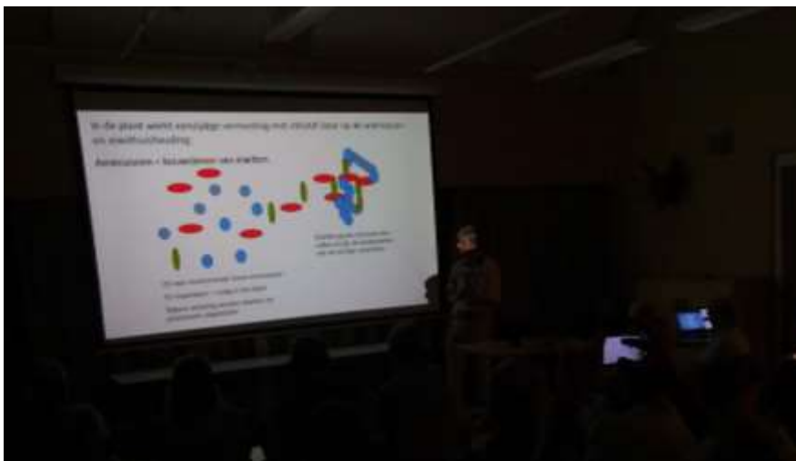
Hybride lezing in Het Groene Huis met Arnold van den Burg. Uiterst rechts de Zoom-laptop.