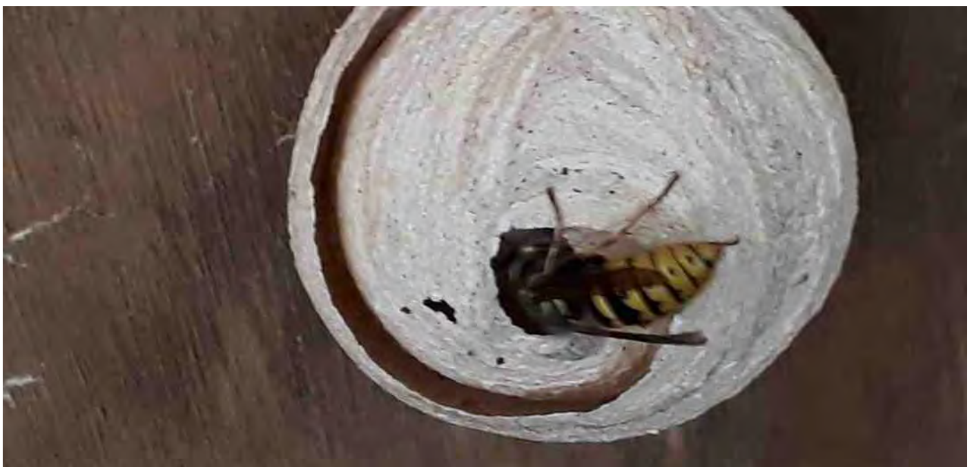
Wespennest zo groot als een pingpongbal.

Dit was echter niet het enige hoogstandje in mijn loopbaan als bestrijdingstechnicus. Onlangs werd ik in een bak van een mobiele kraan omhoog gehesen naar de negentiende verdieping van een woontoren in Vathorst, alwaar een slechtvalk in de dakgoot zijn maaltijden placht te nuttigen. De kadavers van zijn prooien - vogels - lagen daar zo hoog opgedist dat de hemelwaterafvoer verstopt was geraakt. Tientallen wespen hadden de plek inmiddels ontdekt en snoepten van de overgebleven resten van het gevogelte. Mijn restte niets anders dan de zongedroogde inhoud van