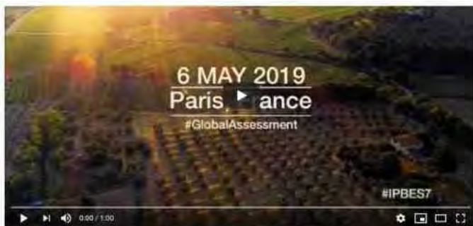
#IPBES7: First Intergovernmental Global Assessment of Biodiversity

Nu klinkt dus een vergelijkbaar alarmsignaal ten aanzien van de mondiale biodiversiteit. Aan dit signaal ligt een omvangrijke studie ten grondslag, naar de oorzaken van de aantasting van biodiversiteit, gevolgen voor de mens en opties om het tij te keren. Honderdvijftig toonaangevende internationale experts uit zo'n vijftig landen hebben aan de studie meegewerkt, ook uit Nederland. Ben je benieuwd