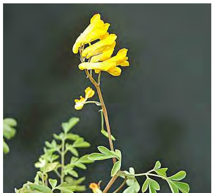
De felgele bloempjes van de gele helmblloem zijn op afstand duidelijk herkenbaar. Ze zijn tweezijdig symmetrisch, dus slechts op één manier door te snijden om een volwaardig spiegelbeeld te krijgen.

De plant bevat een giftig alkaloïde. Deze stof kan bij paarden ontstekingen en zweren in de bek veroorzaken; dit kan leiden tot koliek en zelfs tot de dood. De zwarte zaden zijn voorzien van een mierenbroodje. Dat maakt ze aantrekkelijk voor mieren, die de zaden verslepen en zo bijdragen aan de verspreiding van de plant.