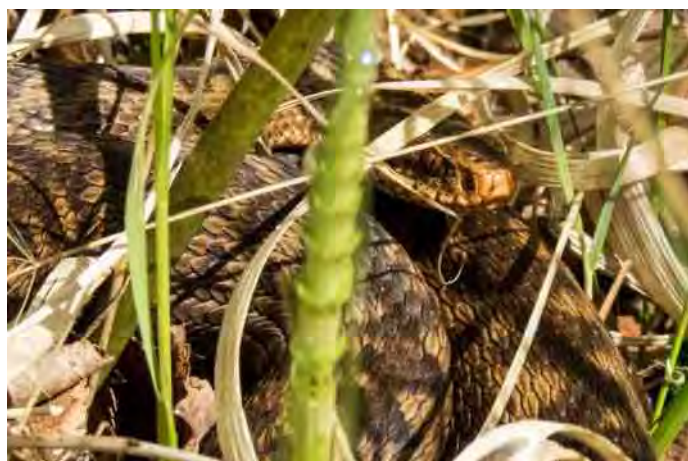
We kwamen onderweg driemaal een adder tegen...