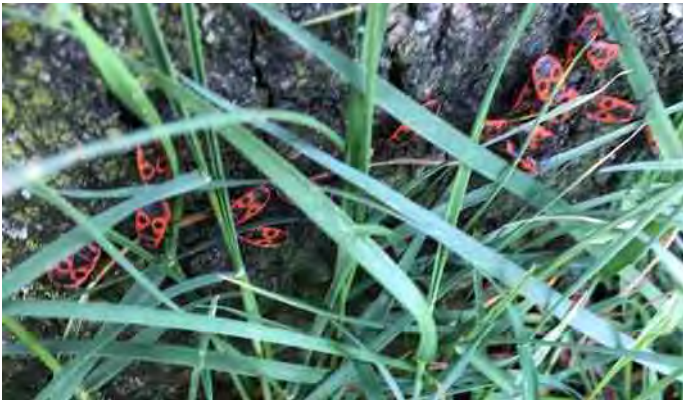
Vuurwantsen koesteren zich in het zonnetje.

Verderop troffen we op het blad van de zwarte els een aantal elzenhaantjes. Ook voor hen was het voortplantingsseizoen begonnen. De eerst nog gave