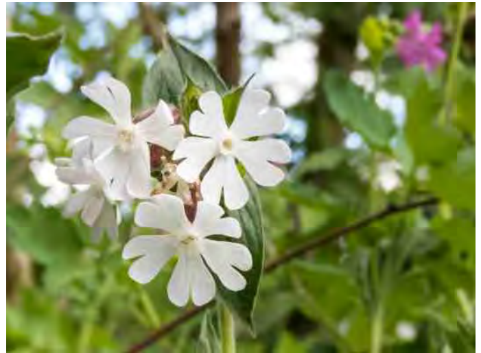
Is dit nu een dag-, nacht- of avondkoekoeksbloem?

Bijna terug bij de parkeerplaats, kwamen we bij een pluk roze en witte koekoeksbloemen: waren die witte nou dag-, nacht- of avondkoekoeksbloemen... dat leverde een levendige discussie op! Nachtkoekoeksbloemen bleken niet te bestaan en de witte avondkoekoeksbloemen gaan eigenlijk pas in de avond