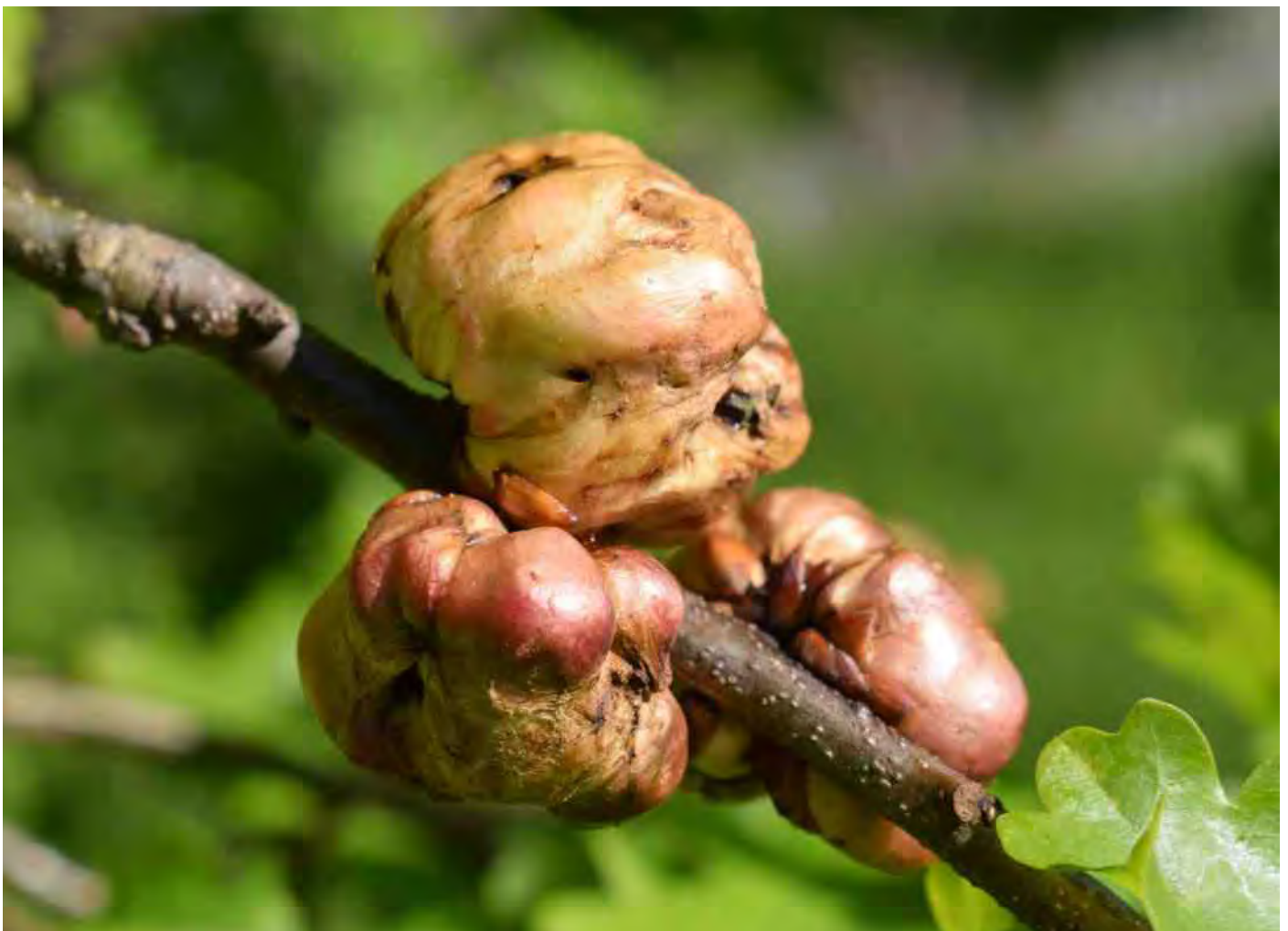
Jonge aardappelgallen zijn wit met een rode blos, later worden ze geelbruin.