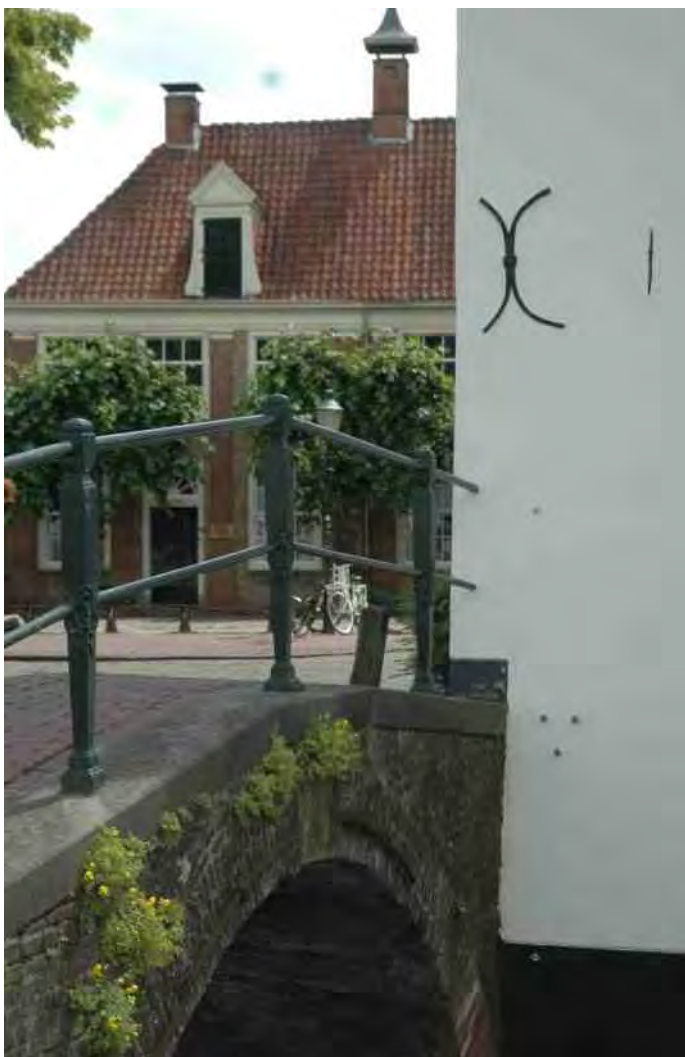
De gele helmblloem is prachtig te bewonderen op de brug van de kruising van het Havik en de Krommestraat in Amersfoort.

De gele helmblloem behoort tot de papaverfamilie, waarvan ook de klapproos en stinkende gouwe deel uitmaken. De plant was zeldzaam en kwam in de vorige eeuw voor op de 'Rode lijst van beschermde plantensoorten'. Sinds 2017 heeft de plant zijn be-