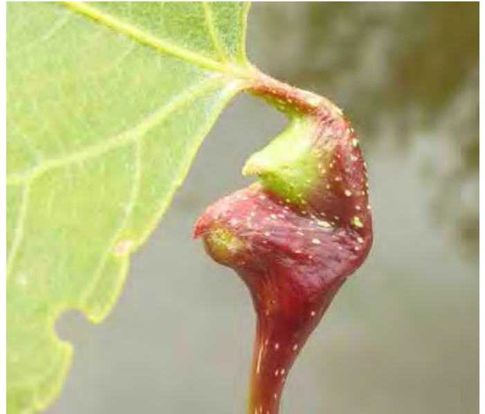
De populierenbeursluis veroorzaakt gallen op de bladstelen van populieren.

De Natuuracademie is een samenwerking van CNME 'Landgoed Schothorst' en de regionale afdelingen van KNNV en IVN in Amersfoort en omgeving. Voor alle cursussen geldt dat aanmelding verplicht is, via email: cnme@amersfoort.nl . Alle cursussen kosten 15 euro. Leden van KNNV- en IVN-afdeling Amersfoort krijgen 5 euro korting. Meer informatie: www.hetgroenehuisamersfoort.nl > ontdekken en leren > Natuuracademie