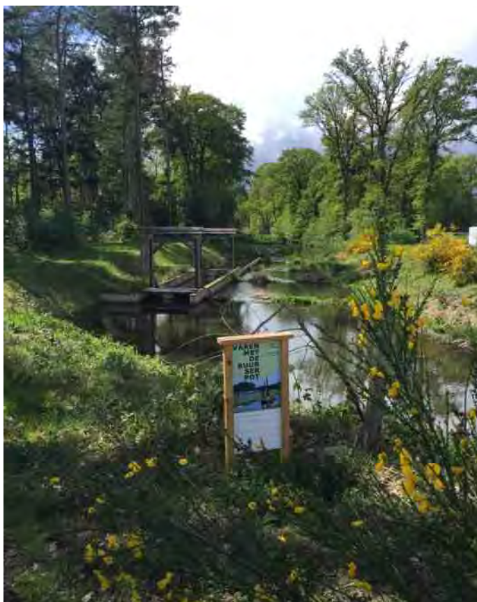
Bij de Haaksberger watermolen

Conclusie: gezellig, leerzaam en leuk! Goede gelegenheid om andere IVN-ers te leren kennen voor mij als nieuweling. Volgend jaar weer!