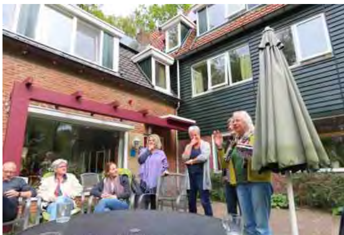
Natuurvriendenhuis Den Broam bij Buurse

Wat bood de eerste wandeling onder leiding van de gids, een gepensioneerde boswachter van dit gebied? In het Haaksbergerveen liepen we langs vennetjes en moerasjes en we zagen de lavendelheide in groten getale bloeien. De boswachter liet ons twee soorten veenmos zien en vertelde over de karakteristieken van hoogveen. Hij wees ons op de dekzandruggetjes waar onze paden overheen gingen, of waar het was aangelegd tijdens de ruilverkaveling. We leerden het onderscheid tussen wollegras (één bolletje wol op de stengel) en veenpluis (drie bolletjes hangen aan de stengel) en we kwamen onderweg driemaal een adder tegen! Toen we ook nog drie kraanvogels boven ons zagen cirkelen, kon de dag niet meer stuk.