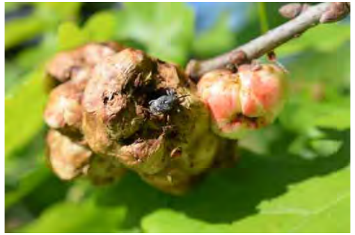
De eikengalboorder is een miniatuurolifant die het op aardappelgallen heeft gemunt.

Thuisgekomen ging ik googlen op de trefwoorden 'aardappelgal' en 'snuitkever'. Tot mijn verrassing hebben we inderdaad een miniatuurolifant die het op aardappelgallen heeft gemunt. Het gaat om de eikengalboorder, die officieel 'Curculio villosus' heet. Dit insect legt haar eitjes in de sponsgallen en de keverlarven krijgen dus een eiwitrijk 'aardappel'-dieet.