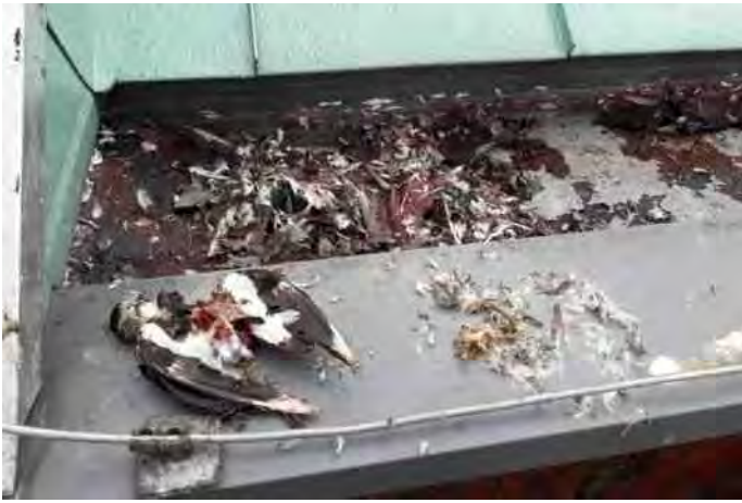
Tientallen wespen snoepen van de restanten van de maaltijden van slechtvalken.

de dakgoot in een plastic afvalzak te deponeren en de duizelingwekkende terugtocht te aanvaarden.