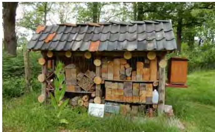
Bijenhotel naast de moestuin bij hoeve Groot Zandbrink.

Bij hoeve Groot Zandbrink aan de Postweg 2 in Leusden onderhouden vrijwilligers een moestuin, en de imkergroep heeft er hun werkzaamheden met bijen, in goed overleg. De tuinders verbouwen groenten voor de voedselbank, en de imkers nemen van de honingbijen een deel van de opbrengt om te verkopen in het theehuis. Vorig jaar is in het kader van NL Doet (Oranjerfonds) een flink stuk grond, begroeid met bramenstruiken, omgevormd tot bostuin. Dit jaar bloeien er wilde- en cultuurplanten ten behoeve van mens en insect. Tegelijkertijd is er op de Oranjedag een wilde bijenhotel gemaakt, dat nog steeds verder wordt uitgebouwd. De bezettingsgraad is al uitermate groot. Een tweede hotel achterin bij de schapen,